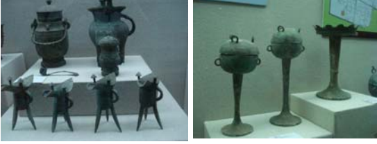
उत्खननात सापडलेल्या धातूच्या वस्तू

यांमध्ये प्रामुख्याने ब्राँझच्या वस्तू आहेत. त्याचेही कीतीतरी आकार आपल्याला पाहायला मिळतात. अगदी मेणबत्तीच्या स्टँडपासून ते बैलगाडीच्या प्रतिकृतीपर्यंतच्या वस्तू आपल्याला आढळतात. त्यांचे वैशिष्ट्य असे की त्या सगळ्या वस्तू स्वच्छ करून पद्धतशीरपणे लावून ठेवलेल्या आहेत. कोणत्याही वस्तूचे छायाचित्र काढण्याची मुभा आहे. त्यामुळे आम्ही भरपूर छायाचित्रे काढली. त्यांतील काही खाली दिलेली आहेत.