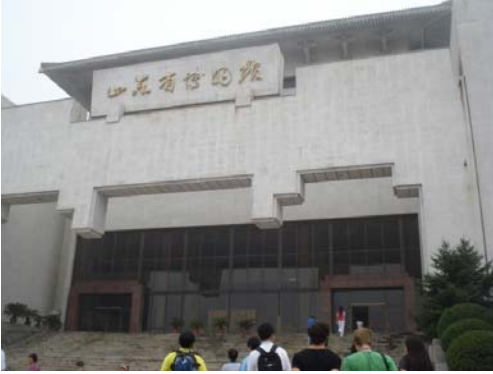
संग्रहालयाची भव्य दगडी इमारत

चीनमध्ये प्रत्येक प्रांताच्या राजधानीच्या ठिकाणी त्या प्रांताचे वैशिष्ट्य विशद करणारे संग्रहालय उभारलेले आहे. जीनान ही शानडॉंग प्रांताची राजधानी असून या शहरात चिनी प्रजासत्ताकाची स्थापना झाल्यावर लगेच या संग्रहालयाची स्थापना करण्यात आली. संग्रहालयाच्या जवळ पोहोचताच त्याची पांढऱ्या रंगाची दगडी इमारत आपल्या नजरेत भरते. जीना चढून संग्रहालयाच्या प्रवेशद्वाराकडे जाण्याआधी मोठ्या दगडात कोरलेल्या कासवाचे आपल्याला दर्शन होते. सहस्रबुद्ध डोंगराच्या पार्श्वभूमीवर बांधलेले हे वस्तुसंग्रहालय सुंदरच नाही तर भव्यदेखील आहे. यात २१,००० मीटर एवढा परिसर प्रदर्शनासाठी ठेवलेला आहे. या संग्रहालयात एकूण १०,५०० एवढ्या वस्तू आहेत. त्याचबरोबर १२,०००० एवढी पुस्तके आहेत. अशा भव्य संग्रहालयाचा जरा फेरफटका मारू या.