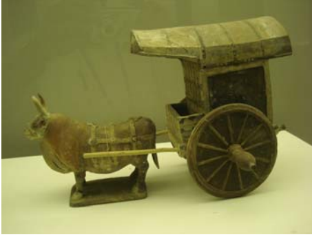
बैलगाडीची हूबेहूब प्रतिकृती

चीनीमातीपासून बनविलेल्या शोभिवंत भांड्यांचा एक वेगळाच विभाग आहे. यांत अगदी लहान कपापासून ते खूप मोठ्या आकाराच्या भांड्यांपर्यंत विविध आकाराच्या आणि रंगाच्या वस्तूंचा समावेश आहे. प्रत्येकावर केलेले नक्षीकाम इतके सुबक आणि सुंदर आहे की पर्यटकांचे लक्ष वेधून घेतल्यावाचून राहात नाही. अशा वस्तू चीनमध्ये अजूनही बनविल्या जात आहेत. बाजारात त्या विकण्यास देखील ठेवलेल्या आढळतात. या संग्रहालयात असलेल्या