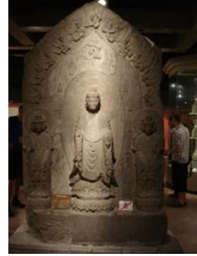
बुद्धाची दगडात कोरलेली मूर्ती

दगडांमध्ये मूर्त्या कोरण्याची कला फार प्राचीन काळात उदयास आली. जेथे मूर्त्या कोरायला योग्य असे दगड आढळले तेथे तेथे लोकांनी मूर्त्या कोरून ठेवलेल्या आहेत. त्यांतील काही मूर्त्यांचे प्रदर्शन या संग्रहालयात केलेले आढळते. त्यातील एक मोठा विभाग राखून ठेवलेला आहे. यावरून ही कला येथे प्रचलित असून आजूबाजूला मूर्त्या कोरण्यास लागणारा दगड मुबलक उपलब्ध आहे याची आपल्याला माहिती मिळते.