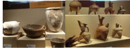
उत्खननात सापडलेली मातीची भांडी

संग्रहालयात प्रवेश करून आपण डावीकडे वळतो तोच आपल्याला उत्खननात सापडलेल्या वस्तूंचे प्रदर्शन पाहायला मिळते. यांत प्रामुख्याने मातीची भांडी आणि धातूच्या वस्तू आढळतात. वस्तू कोणत्या ठिकाणी उत्खननात सापडली तिचा कालावधी काय असावा याची माहिती सविस्तरपणे दिलेली आहे. लाकडी कपाटात या वस्तू ठेवलेल्या असून काचेच्या तावदानातून त्या स्पष्टपणे पाहता याव्यात यासाठी चांगली प्रकाशयोजना केलेली आहे.