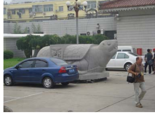
प्रवेशद्वाराजवळ असलेला दगडी कासव

संग्रहालयात प्रवेश करून आपण डावीकडे वळतो तोच आपल्याला उत्खननात सापडलेल्या वस्तूंचे प्रदर्शन पाहायला मिळते. यांत प्रामुख्याने मातीची भांडी आणि धातूच्या वस्तू आढळतात. वस्तू कोणत्या ठिकाणी उत्खननात सापडली तिचा कालावधी काय असावा याची माहिती सविस्तरपणे दिलेली आहे. लाकडी कपाटात या वस्तू ठेवलेल्या असून काचेच्या तावदानातून त्या स्पष्टपणे पाहता याव्यात यासाठी चांगली प्रकाशयोजना केलेली आहे.